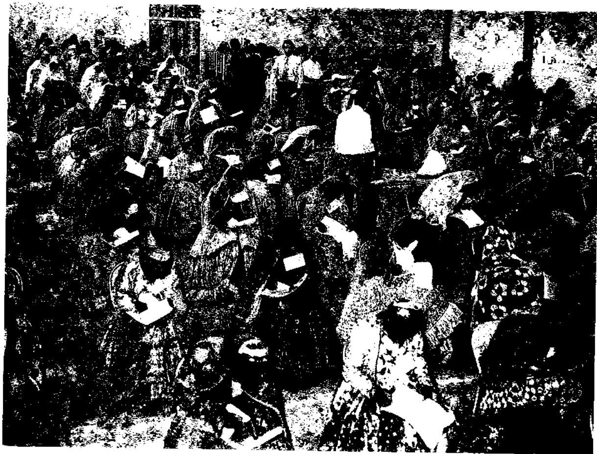
دوشیزگان عشایر در سالن امتحانات مسابقه ورودی دانشسرای تربیت معلم