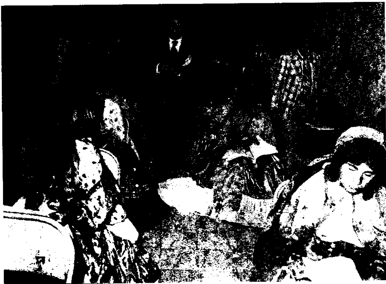
دوشیزگان عشایر در سائن امتحانات مسابقه ورودی دانشسرای تربیت معلم