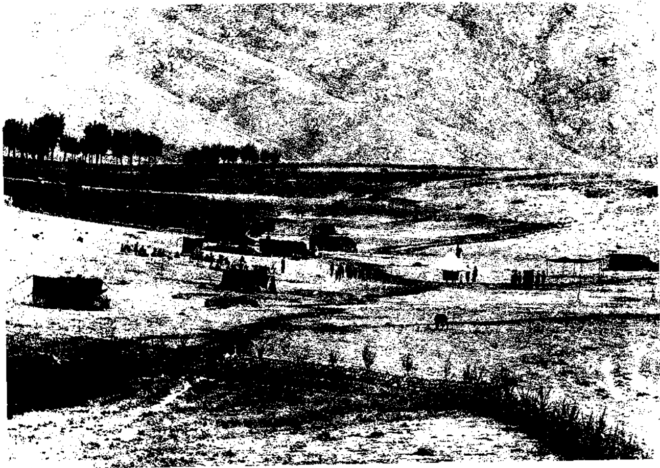
تصویری از یک دهستان سیار