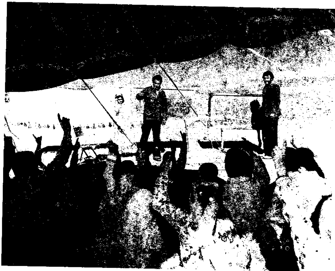
تصویری از یک دبستان سیار