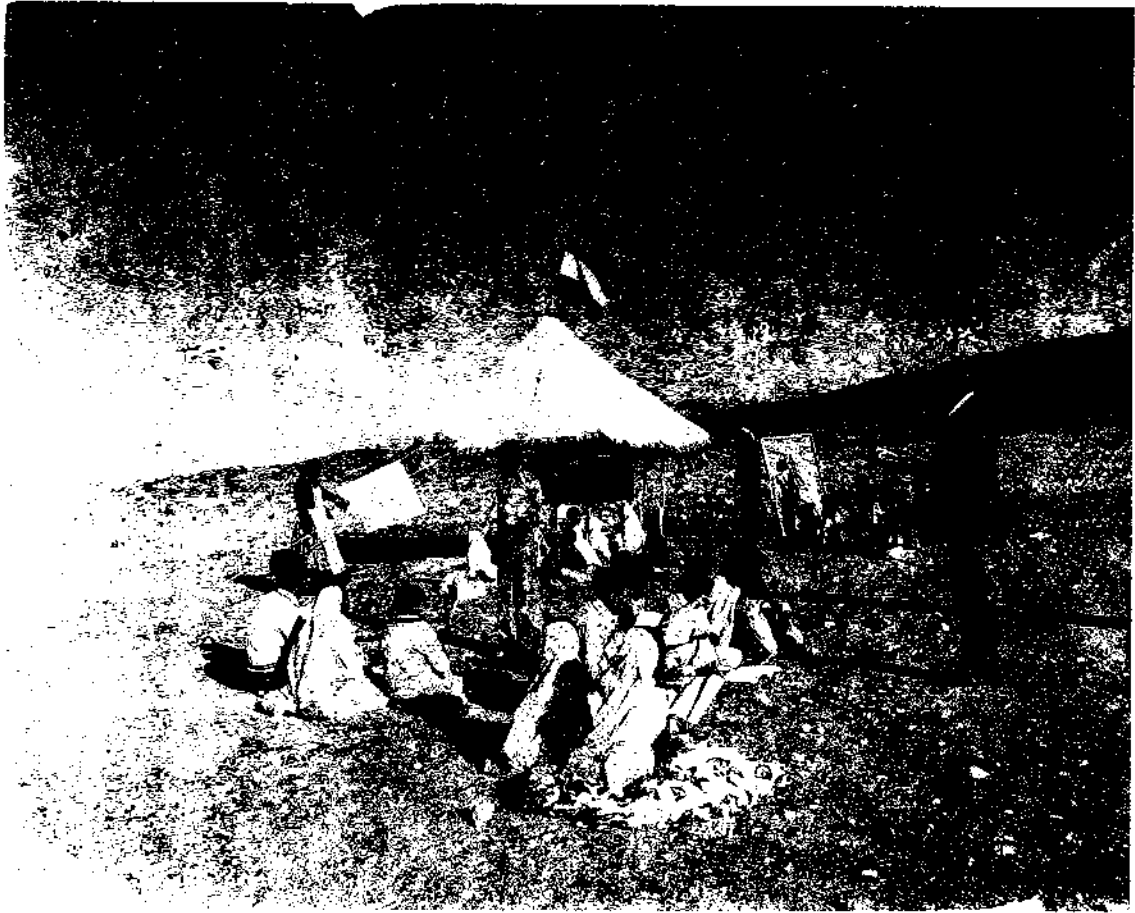
تصویری از یک دبستان سیار