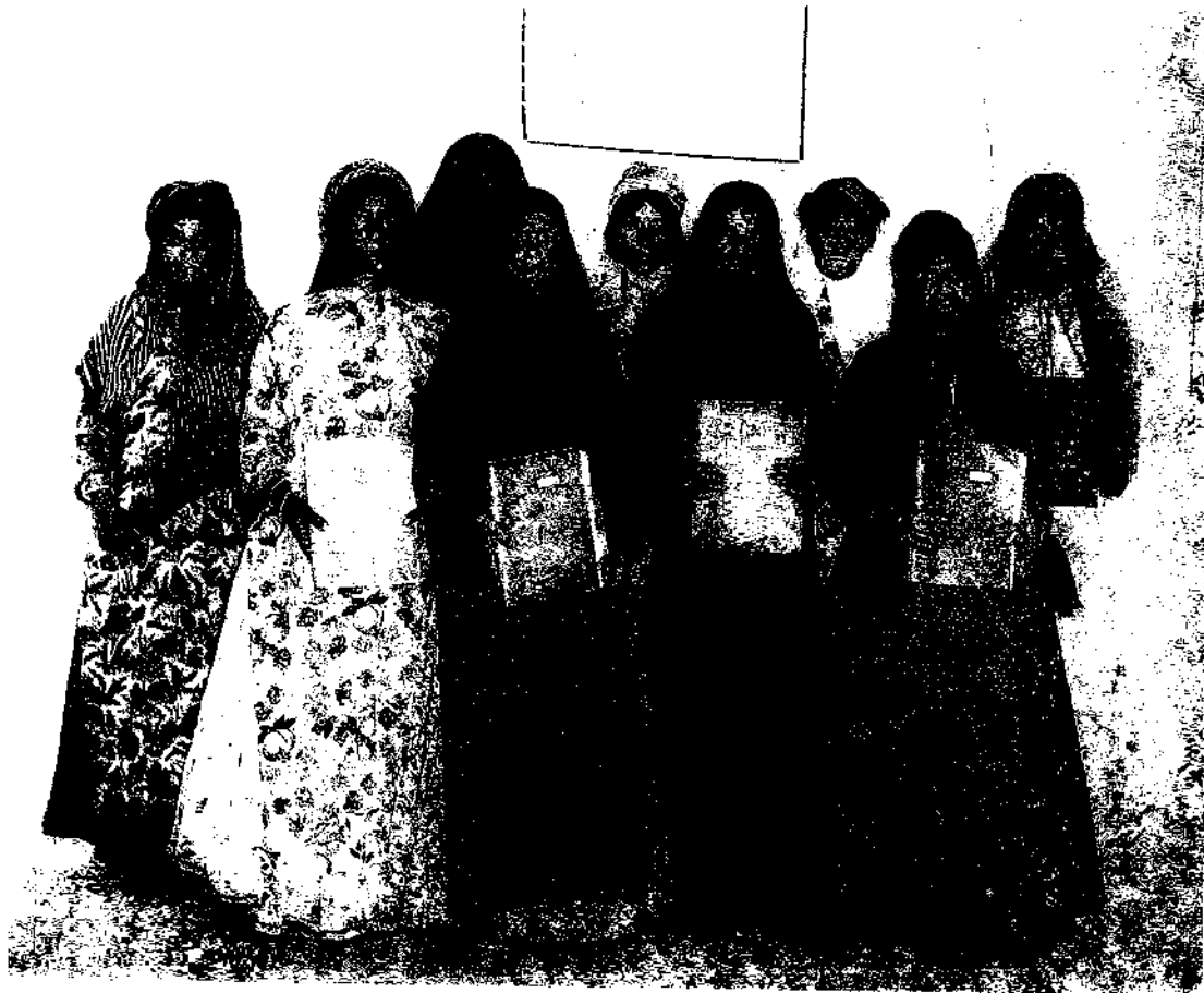
عده‌ای از قابله‌های قدیمی ایل که برای دیدن یک دوره کوتاه به شیراز آورده شدند